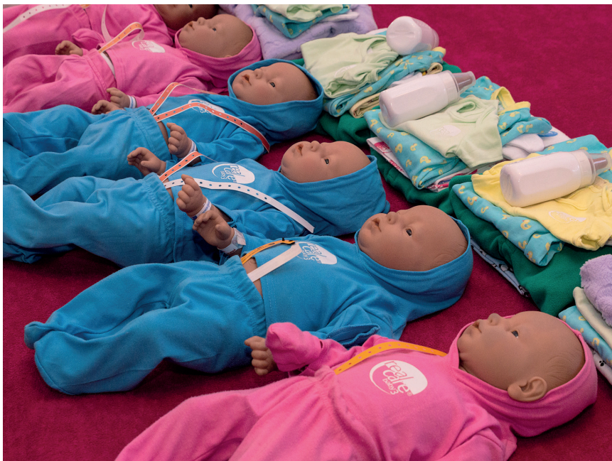
fot. Fundacja Dom Marzeń

Zdobywanie kolejnych umiejętności jest dokumentowane w dzienniczku uczestnika warsztatu. To tam OzNI biorące udział w warsztacie wpisują własną ocenę jakości wykonanej czynności przy wsparciu opiekuna, który w razie potrzeby pomaga uczestnikowi wyrazić jego odczucia.