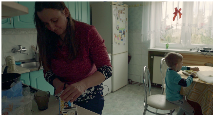
Kadr z filmu o My też jesteśmy rodzicami! , Sangaj Studio Filmowe Dorota Migas-Mazur

Warto zapewnić opiekę dla dzieci na czas trwania zajęć warsztatowych.