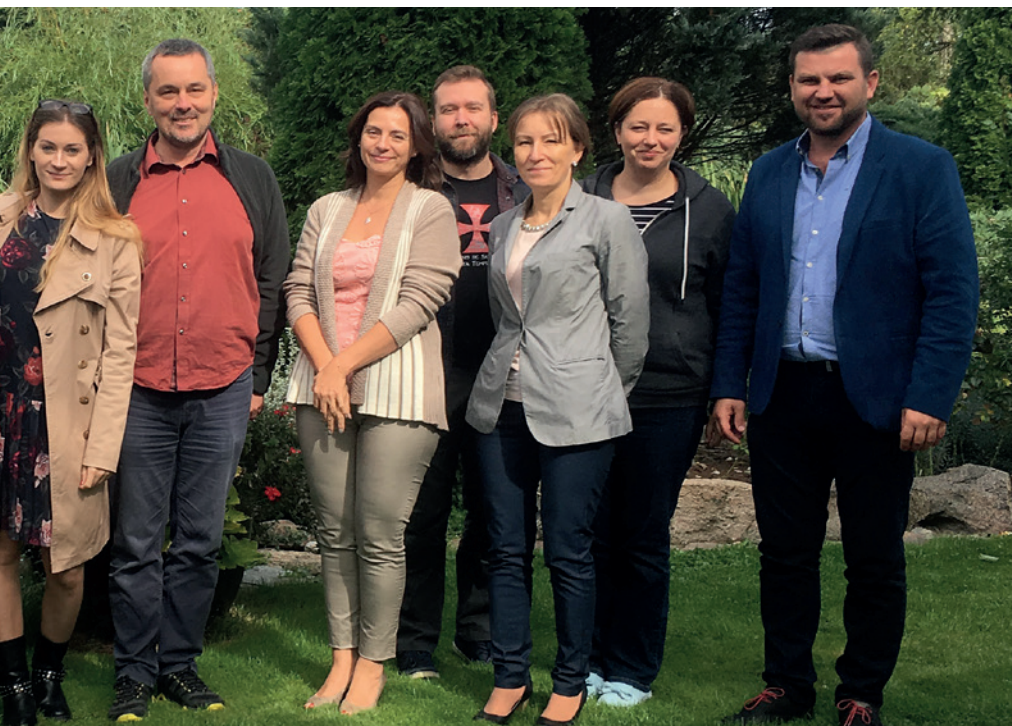
Zespół Hospicjum Proroka Eliasza.

opieka nad nimi nie jest finansowana z kontraktu z NFZ. Decyzja taka oznacza jednak dla hospicjum nie tylko konieczność pozyskania dodatkowych źródeł finansowania, ale także takiego zorganizowania pracy zespołu hospicyjnego, aby w optymalny sposób wykorzystać zatrudniony personel medyczny, np. poprzez nieobciążanie specjalistów czynnościami, które mogą być wykonane przez inne osoby. W 2018 r., kiedy przeprowadzany był pilotaż innowacji, o której piszemy w niniejszym poradniku, pod opieką hospicjum pozostawało łącznie 35 osób, z czego połowa nie kwalifikowała się do dofinansowania z NFZ.