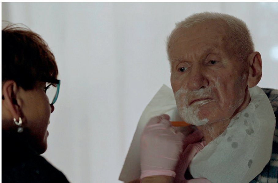
Kadr z filmu o innowacji Nowy model hospicjum domowego, Sangaj Studio Filmowe Dorota Migas-Mazur

Przetestowany przez Fundację Hospicjum Proroka Eliasza „Nowy model hospicjum domowego na terenach wiejskich” polega na rozszerzeniu zakresu wskazań do objęcia opieką hospicyjną osób chorych oraz uelastycznieniu opieki nad chorymi poprzez włączenie w nią przeszkolonych opiekunek (w trakcie testowania były to same kobiety), które poza świadczeniem bezpośredniej opieki nad chorymi wspierają – często starszych i schorowanych – opiekunów domowych.