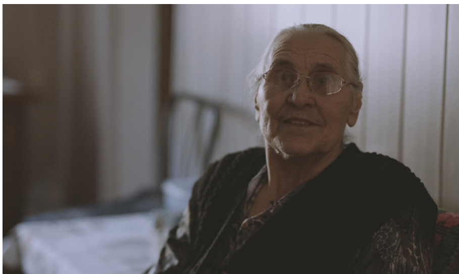
Kadr z filmu o innowacji Nowy model hospicjum domowego, Sangaj Studio Filmowe Dorota Migas-Mazur

Jak pokazuje doświadczenie z pilotażu, ogromne znaczenie ma też ich gotowość do rozmowy i towarzyszenia chorym, którzy nie mogą liczyć na wsparcie rodziny.