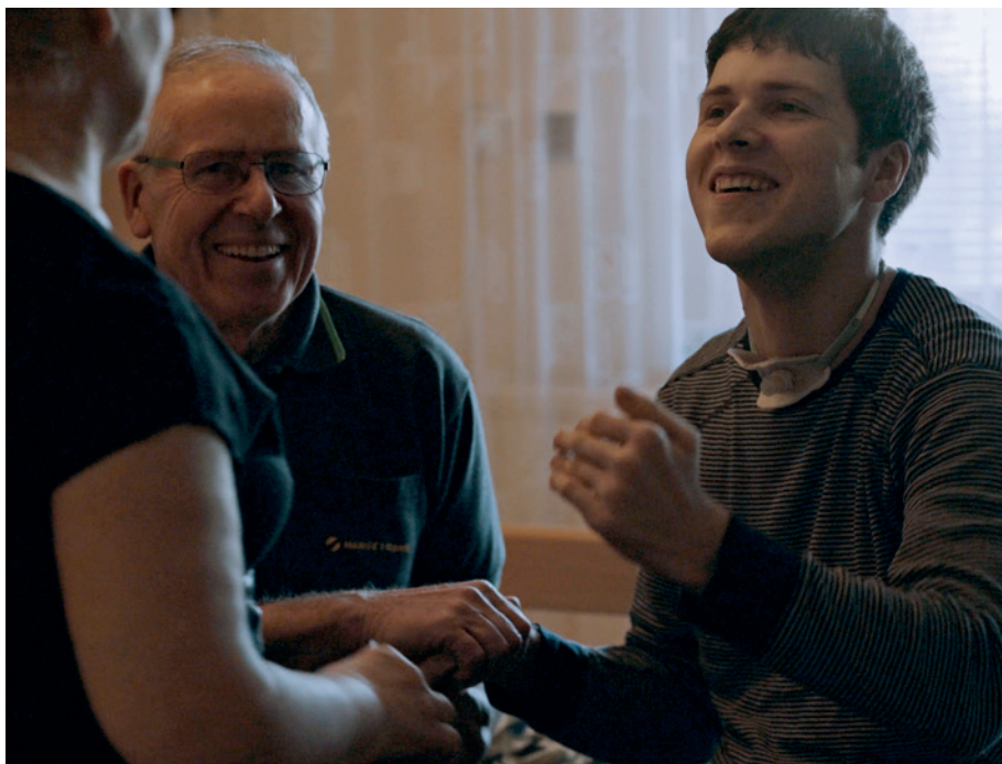
Kadr z filmu o innowacji Nowy model hospicjum domowego, Sangaj Studio Filmowe Dorota Migas-Mazur

Ruch hospicyjny w Polsce jest stosunkowo młody. Kompleksową opiekę paliatywną nad terminalnie chorymi podjęto po raz pierwszy w 1972 r. w Zespole Synodalnym Kościoła Arki Pana w krakowskiej Nowej Hucie. Zawiązana podczas budowy świątyni grupa parafialna, w skład której wchodził także lekarze i pielęgniarki, postanowiła bezinteresownie służyć nieuleczalnie chorym na nowotwory w jednym z krakowskich szpitali, a następnie podjęła inicjatywę wybudowania specjalnego domu hospicyjnego. 29 września 1981 r. pomysłodawcy tej pionierskiej inicjatywy powołali pierwsze polskie stowarzyszenie hospicyjne – Towarzystwo Przyjaciół Chorych „Hospicjum”. W ślad za nim powstawały kolejne podobne przedsięwzięcia, ale rozkwit ruchu hospicyjnego przypadł dopiero na lata 90. ubiegłego wieku.