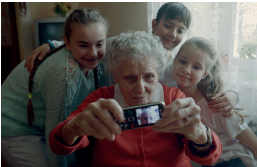
Kadr z filmu o Sztafecie pokoleń