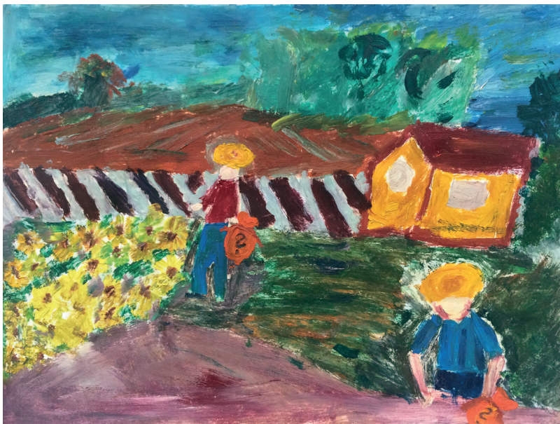
ilustracja Aleksandra Nowak

Innowacyjne narzędzie to zaprojektowana z myślą o ONI podręczna i symboliczna sakiewka, w której osoba z niepełnosprawnością intelektualną może umieścić zwinętą w rulonik kartkę z treścią wyrażającą jej oczekiwania wobec drugiego człowieka. To narzędzie stwarza szansę na wzmacnianie pozytywnych reakcji otoczenia, unikanie moralizatorstwa, konfliktu i agresji na rzecz pozytywnej narracji poprzez przełamanie konwencji w chwili, gdy osoba z niepełnosprawnością intelektualną wychodzi do osoby pełnosprawnej, oferując przyjacielski gest i „gadżet” – ocieplacz relacji .